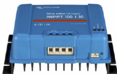
Controlador de carga solar MPPT 100/30